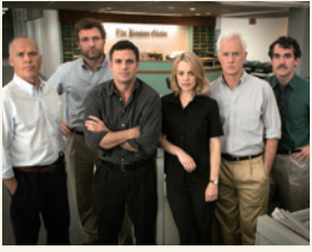
『スポットライト 世紀のスcoop』

▲マット・デイモン主演の火星サバイバル超大作『オデッセイ』(2月5日)。リドリー・スコット監督が久々に賞レースに参戦！