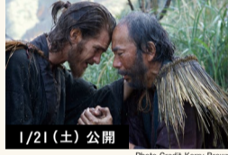
1/21 (土) 公開

監 マーティン・スコセッシ 原 遠藤周作『沈黙』（新潮文庫刊） 出 アンドリュー・ガーフィールド / リアム・ニーソン アダム・ドライバー / 窪塚洋介 / 浅野忠信 / イッセー尾形 塚本晋也 / 小松菜奈 / 加瀬亮 / 炭田ヨシ