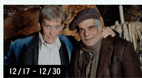
12/17 - 12/30

1929年、チリ生まれの映画監督・脚本家・俳優。代表作はカルト・クラシックとして名高い『エル・トポ』(70)、『ホーリー・マウンテン』(73)、『サンタ・サングレ/聖なる血』(89)。撮影が頓挫した幻の超大作『DUNE』は、未完にもかかわらず『映画史を変えた』とまで言われている。自伝的映画『リアリティのダンス』(13)の続編となる最新作『エンドレス・ボエトリー』が2017年日本公開予定。