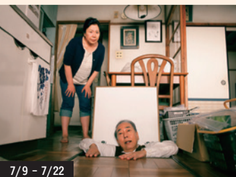
7/9 - 7/22

阪本順治監督が、数々の映画賞に輝いた名作『顔』以来16年ぶりに藤山直美を主演に迎えたしゃべりコメディ！ある事情を抱えた夫婦が大阪近郊の団地に引っ越してくる。夫婦をめぐる団地の住人たちのウワサや妄想がやがて大騒動に発展し…。阪本組の芸者たちによる掛け合いは爆笑必至！