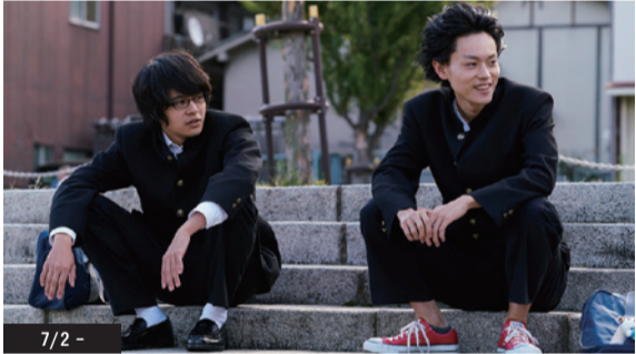
© 此元祐津也 (別冊少年チャンピオン) 2013 © 2016 映画「セトウツミ」製作委員会