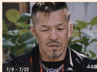
7/9 - 7/22

40歳を越えた今なお現役にこだわり続けるボクサー、元WBC世界バンタム級チャンピオン辰吉丈一郎。その生き様に魅了された阪本順治監督が、辰吉が25歳だった1995年から20年にわたって撮られたインタビュー映像をもとに、誰も見たことがない“真実の辰吉丈一郎”を捉えたドキュメンタリー。