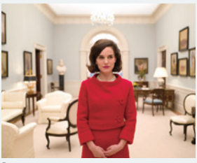
『ジャッキー ファーストレディ最後の使命』

さあ、今年も楽しいアカデミー賞の季節がやってまいりました！本誌11月号でもご紹介したデミアン・チャゼル監督のミュージカル映画『ラ・ラ・ランド』(2月24日)は、期待通りゴールデングローブ賞7部門の最多受賞を果たしました。